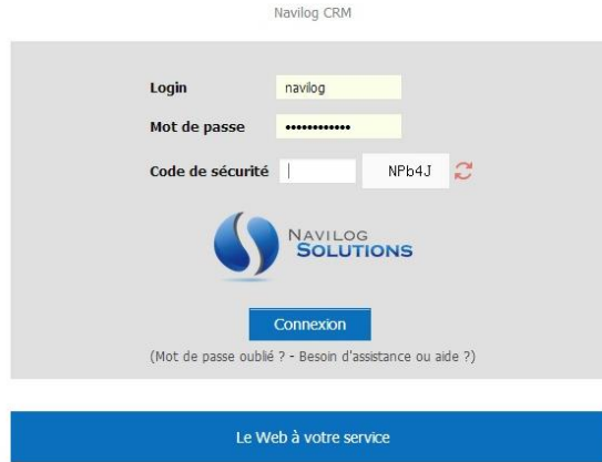
Figure 1 : Ecran de connexion